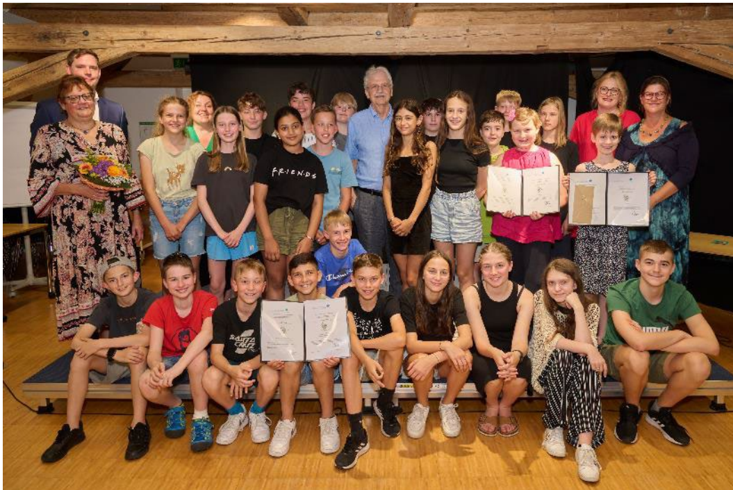
Jubilär Paul Maar im Kreis der Gratulantinnen und Gratulanten bei der Preisverleihung am 7. Juli 2023 in der Stadtbücherei Bamberg

Volkach / Bamberg, 7. Juli 2023 – Jeder kennt das Sams und Herrn Taschenbier und Frau Rotkohl. Der Mann, der sich diese Geschichten ausgedacht hat, Paul Maar, ist gerade 85 Jahre alt geworden. Da möchte man ihm (und dem Sams!) doch am liebsten einen Riesenblumenstrauß zum Geburtstag schicken, oder nicht?!